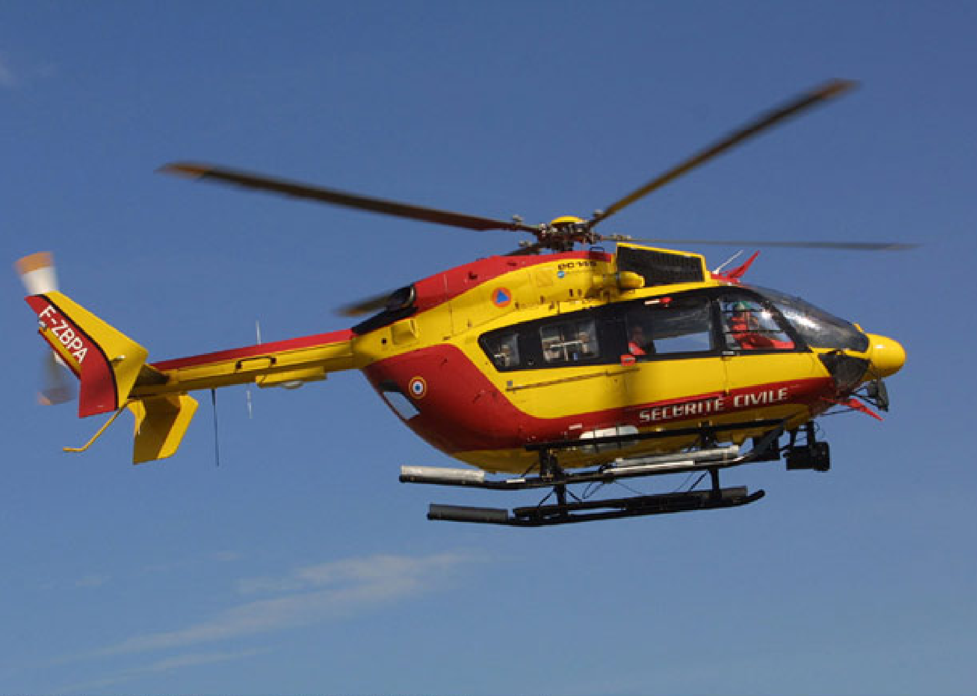
EC 145 - Nimes, 23.04.2002